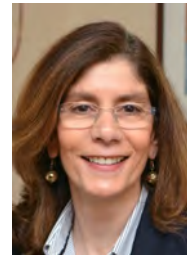
Prof. Pinelopi Koujianou Goldberg (Advisory Board Member)